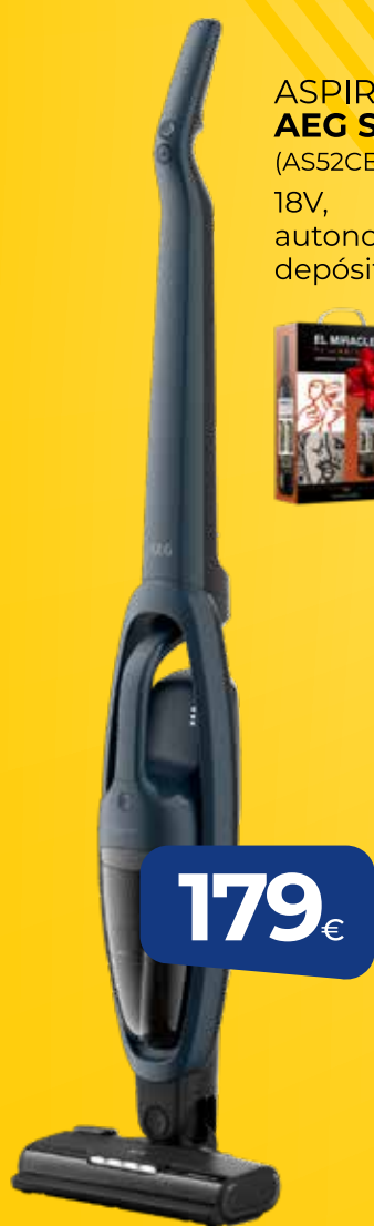
ASPIRADOR 2 EN 1 AEG SERIE 5000 (AS52CB18DB) 18V, autonomía 45min, depósito 0,3L