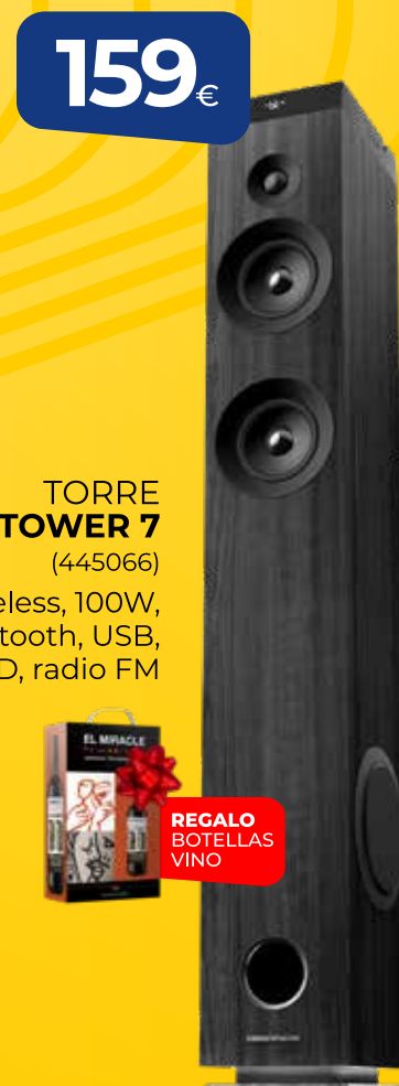
TORRE ENERGY TOWER 7 (445066) TrueWireless, 100W, Bluetooth, USB, MicroSD, radio FM