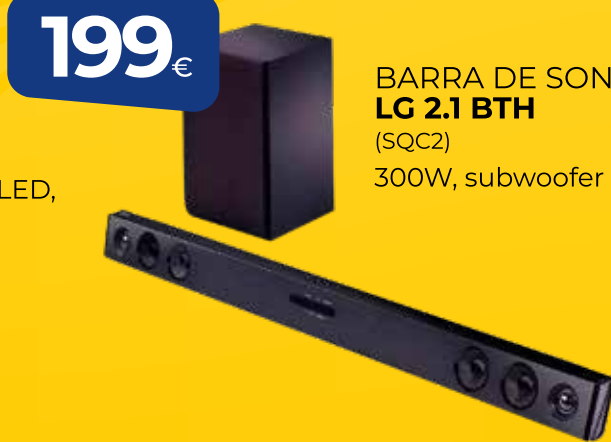
BARRA DE SONIDO LG 2.1 BT (SQC2) 300W, subwoofer inalámbrico