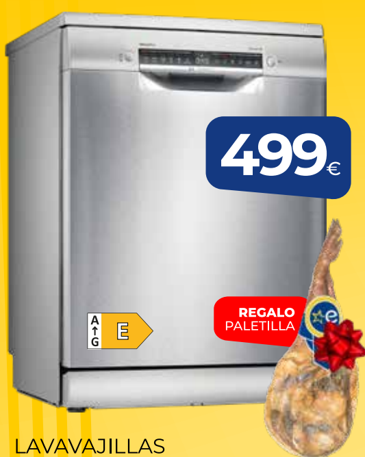
LAVAVAJILLAS BOSCH (SMS25AI05E) 12 servicios, inox, 5 programas, cuba mixta

ESTA NAVIDAD COMPRA EN EURONICS Y LLÉVATE DE REGALO UNA PALETILLA O DOS BOTELLAS DE VINO