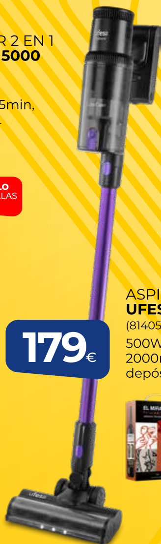
ASPIRADOR ESCOBA UFESA SAHARA (81405724) 500W, 29,6V, 2000mAh, depósito 0,6L