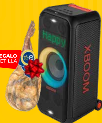
ALTAVOZ LG XBOOM (XL7S) IPX4, 250W, Bluetooth, USB, pantalla e iluminación LED, batería hasta 20h