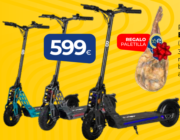
PATÍN ELÉCTRICO B-MOV 5 10" (BMOV5) 3 colores, 800W, rueda 10" (25,4cm), batería 48V, autonomía hasta 45Km