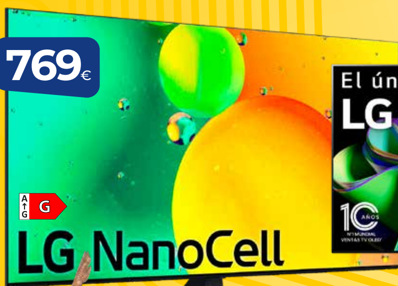
TELEVISOR LG NANO UHD 65" (164cm) (65NANO766QA) Smart TV