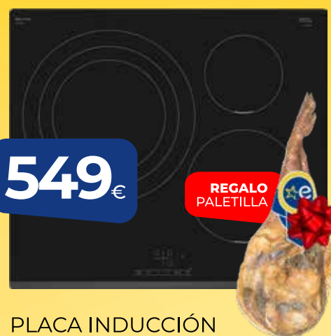
PLACA INDUCCIÓN BOSCH (PID631BB5E) 60cm, 3 zonas, 1 zona 32 cm, bisel delantero

ESTA NAVIDAD COMPRA EN EURONICS Y LLÉVATE DE REGALO UNA PALETILLA O DOS BOTELLAS DE VINO