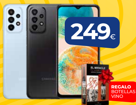
TELÉFONO MÓVIL SAMSUNG GALAXY A23 (Azul: A236BLBVEUB) (Negro: A236BZKVEUB) 5G, pantalla 6,6" (16,76cm), memoria 4Gb, RAM 128Mb