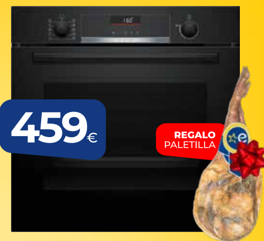
HORNO BOSCH (HBA5360B0) 71 L, hidrólisis, raíles intercambiables en altura