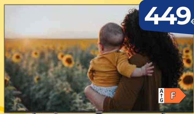
TELEVISOR GRUNDIG UHD 55" (139cm) (55GHU7970B) Google TV