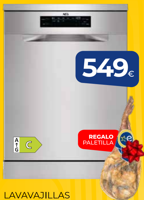
LAVAVAJILLAS AEG (FFB74907ZM) 14 servicios, inox, 3a bandeja